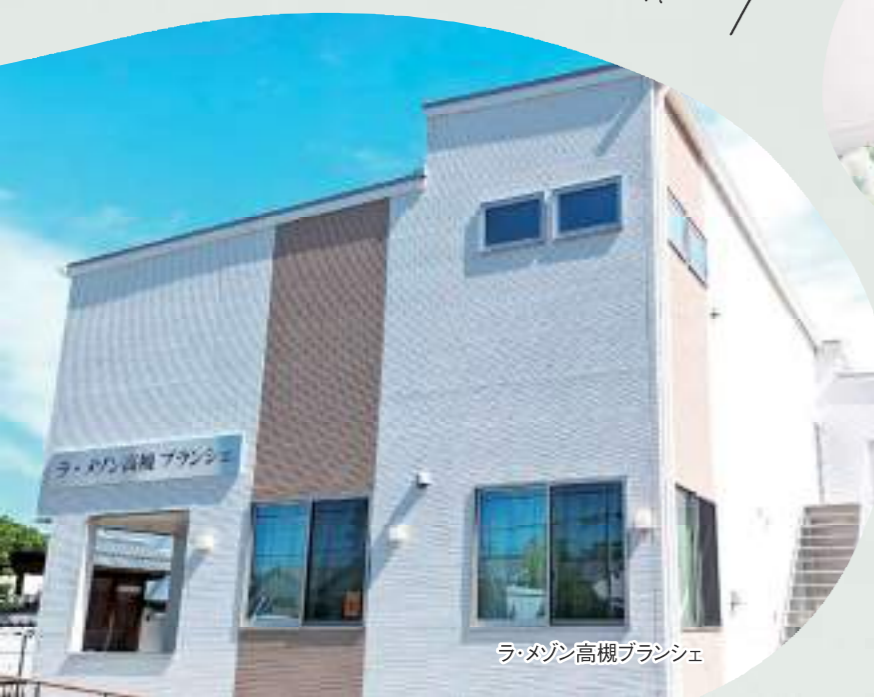
ラ・メゾン高槻ブランシェ

高槻市営バス「芝生住宅東口」 「芝生西口」停留所より徒歩2分 ご家族の方も通いやすい立地です!