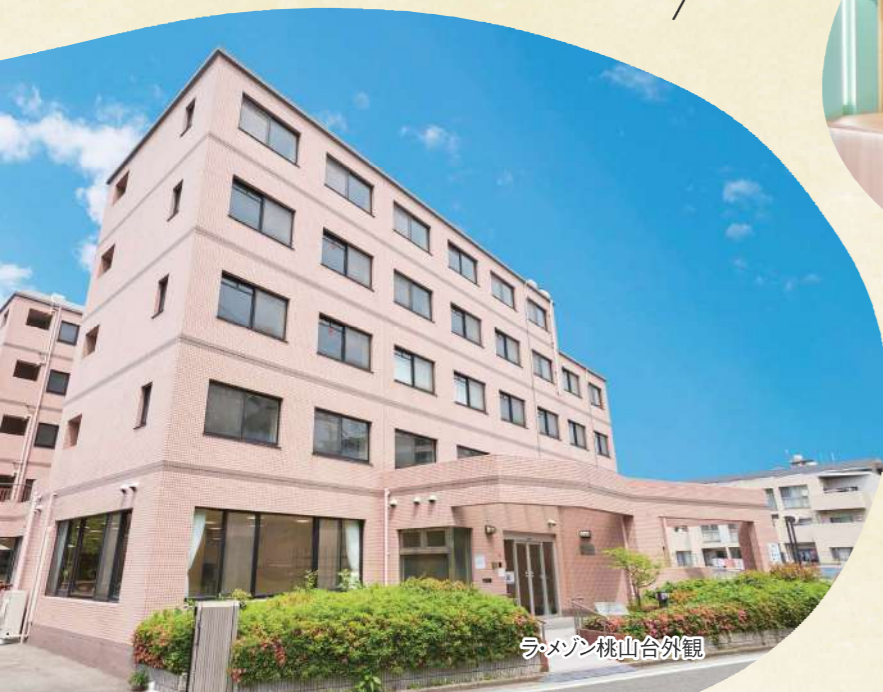
ラ・メゾン桃山台外観