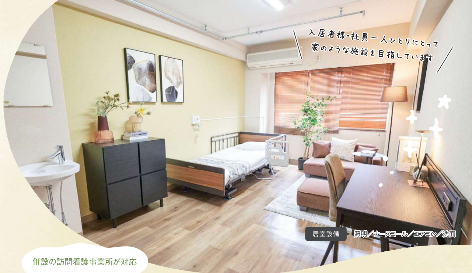
居室設備 照明/カーソール/エアコン/洗面