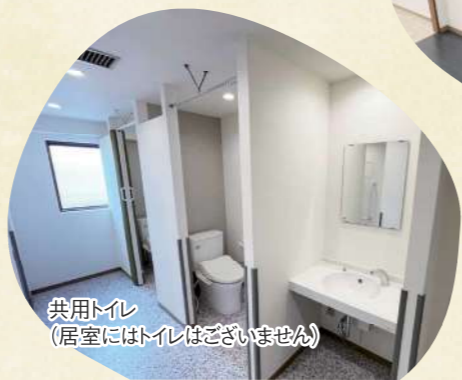
共用トイレ (居室にはトイレはございません)