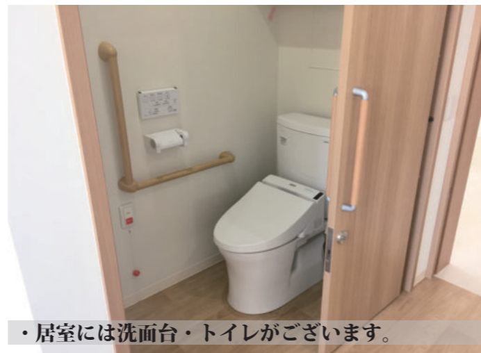
・居室には洗面台・トイレがございます。