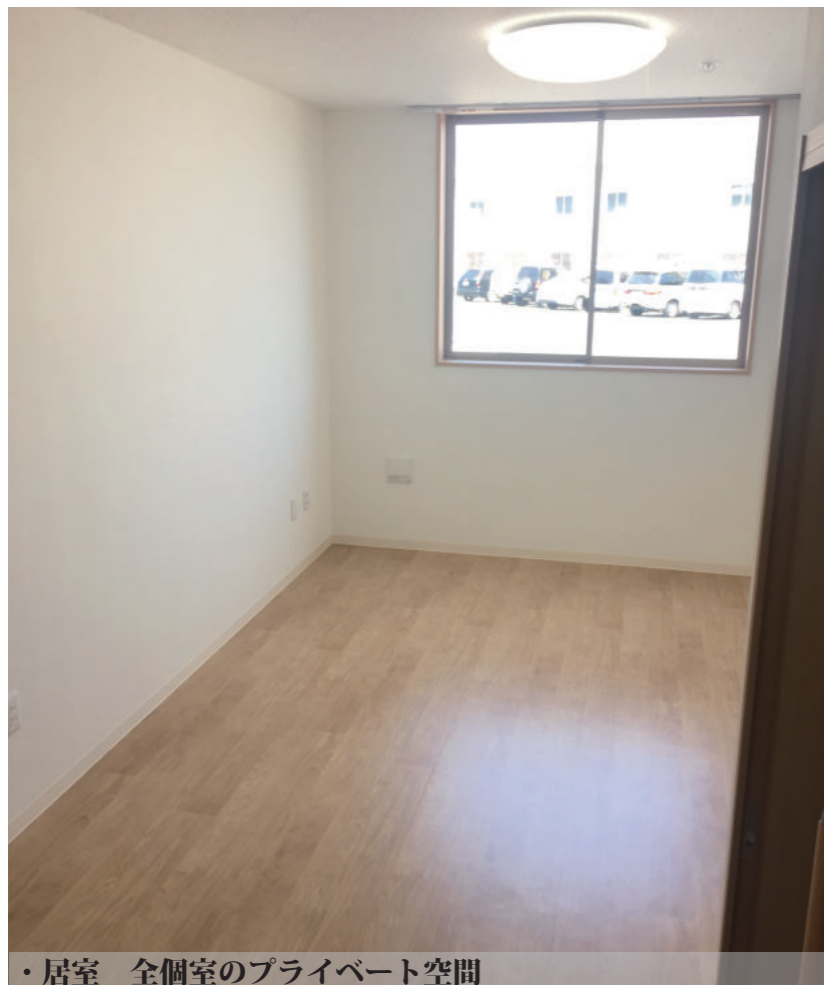
・居室 全個室のプライベート空間