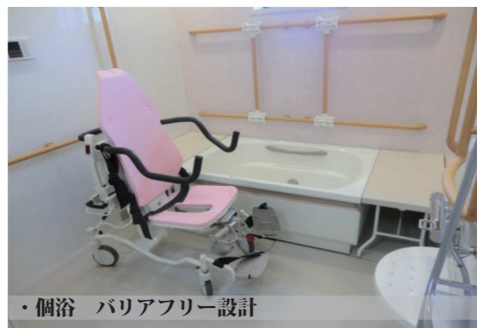
・個浴 バリアフリー設計